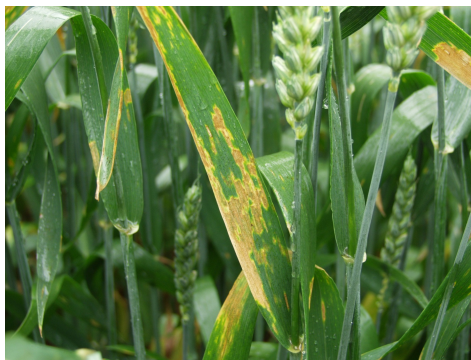
Billede 2. Septoria (hvedegråplet) er Danmarks "nationalsygdom" i hvede og den sygdom, som aksbeskyttelsen oftest er rettet imod.