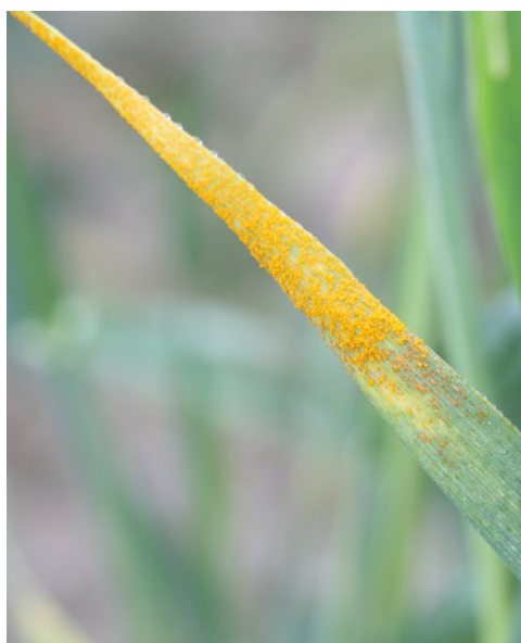
Billede 3. Ved tidlige angreb sidder gulrustsporerne ikke i striber, men spredt på bladet.