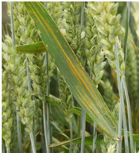
Billede 4. Senere sidder gulrustsporerne i striber på bladet. Gulrust bekæmpes ved konstateret forekomst fra begyndende vækst i modtagelige