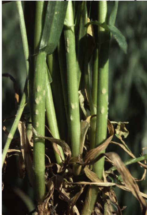
Billede 1. Meldugangreb begynder tit nederst på stænglerne.

Maks. antal behandlinger. Folicur/Orius, Proline og Provaro bør maks. anvendes to gange pr. sæson i hvede.